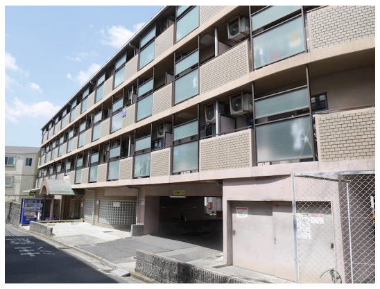
グランフォルム2024年10月リノベーション