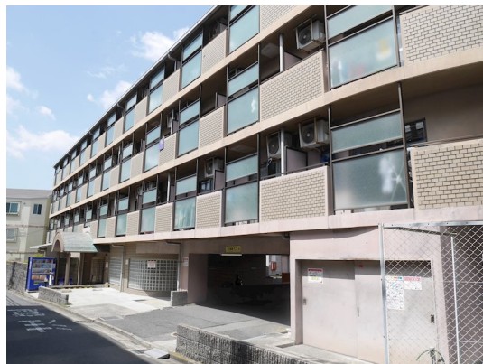
グランフォルム2024年10月リノベーション